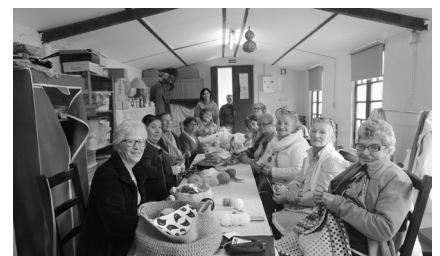
Ateliê Lãs Solidárias