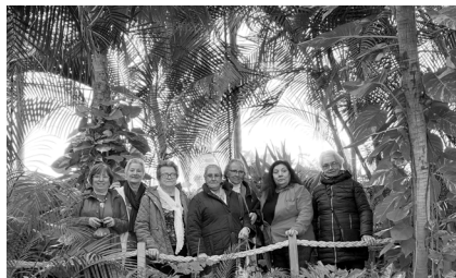
Velhas Amigas no Oceanário