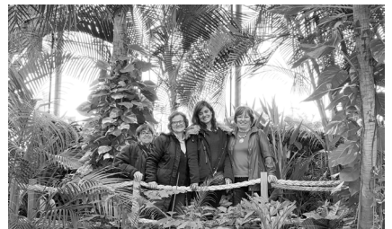
Velhas Amigas no Oceanário