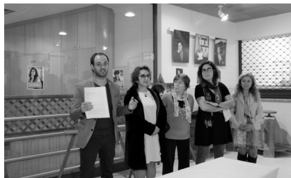
Dia Municipal para a Igualdade