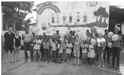
Arcar, Maxivisão e iCreate - S. Tomé e P.