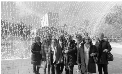
Velhos Amigos no Oceanário