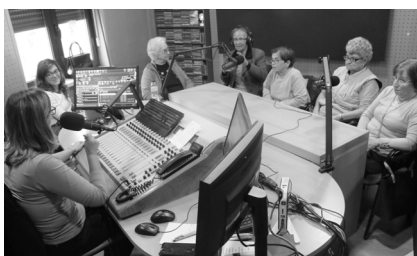
Debate sobre a Solidão na rádio