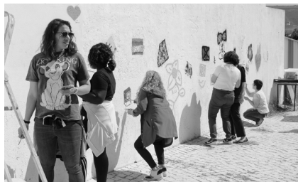
Pintura de mural