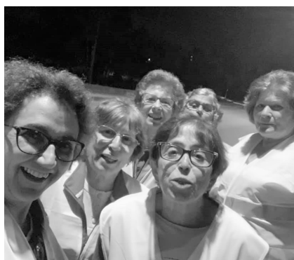
Caminhadas em Poaires