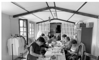
Ateliê Costura Criativa