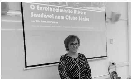
CVA - Estudo de Campo - Doutoramento