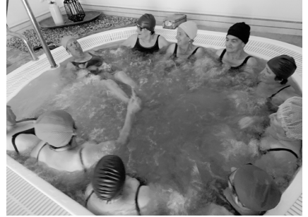
SPA no Hotel Vila Galé

visitámos o Oceanário e desfrutámos de toda a beleza da fauna e da flora dos oceanos. Após o almoço, comemorámos na Cinemateca o dia Mundial do Cinema e o centenário de Jorge de Sena, com a visualização do filme “Sinais de Fogo” realizado por Luís Filipe Rocha, seguindo-se uma conversa animada com o realizador.