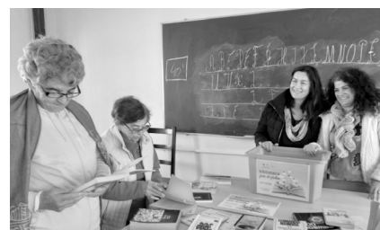
Biblioteca fora de portas