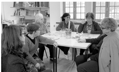
Debate sobre as notícias