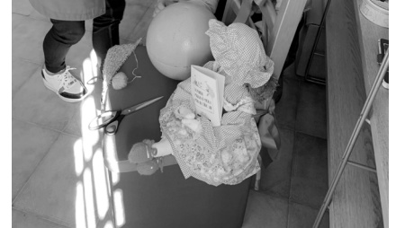
As Cadeiras do Curso de Vida da Matobra