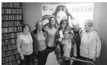
Velhos Amigos na Rádio