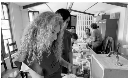
Ateliê Mãos à Obra