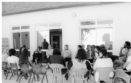
Poesia e debate