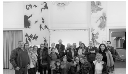
Velhos Amigos na Cinemateca