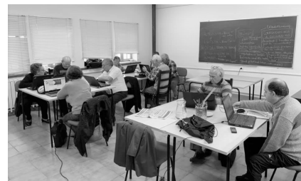
Literacia das TIC