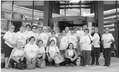
SPA no Hotel Vila Galé