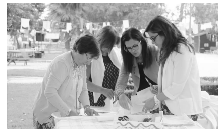
Festival Cabelos Brancos - Ìlhavo