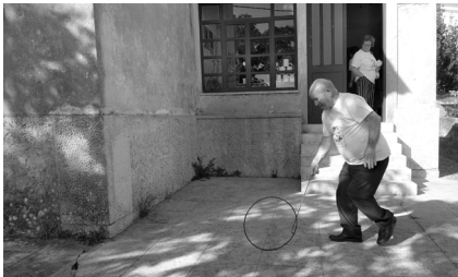
Escola do Brinquedo Tradicional Popular