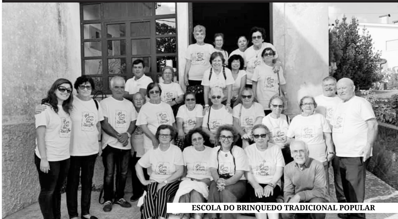
ESCOLA DO BRINQUEDO TRADICIONAL POPULAR