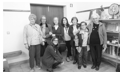
Os livros do clube