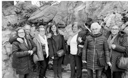
Velhos Amigos no Oceanário