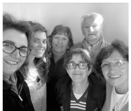
Grupo de meditação 2 as feiras 10h30-11h30