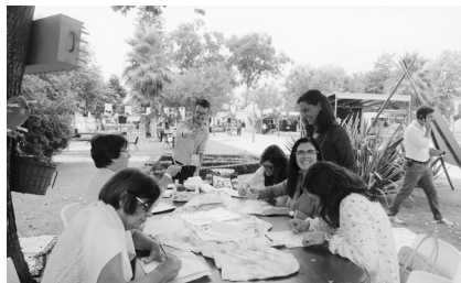
Festival Cabelos Brancos - Ìlhavo