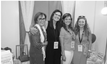
A equipa da iCreate na Poiartes'19

Estas foram algumas das atividades desenvolvidas durante o último trimestre de 2019 com a participação da equipa e sócios/as do Clube dos Velhos Amigos.